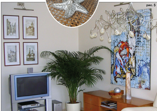
Интерьер, покупай лучшее / сентябрь 2011 г.