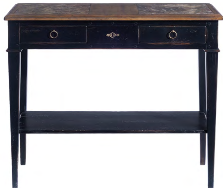
B931 CONSOLE RECAMIER