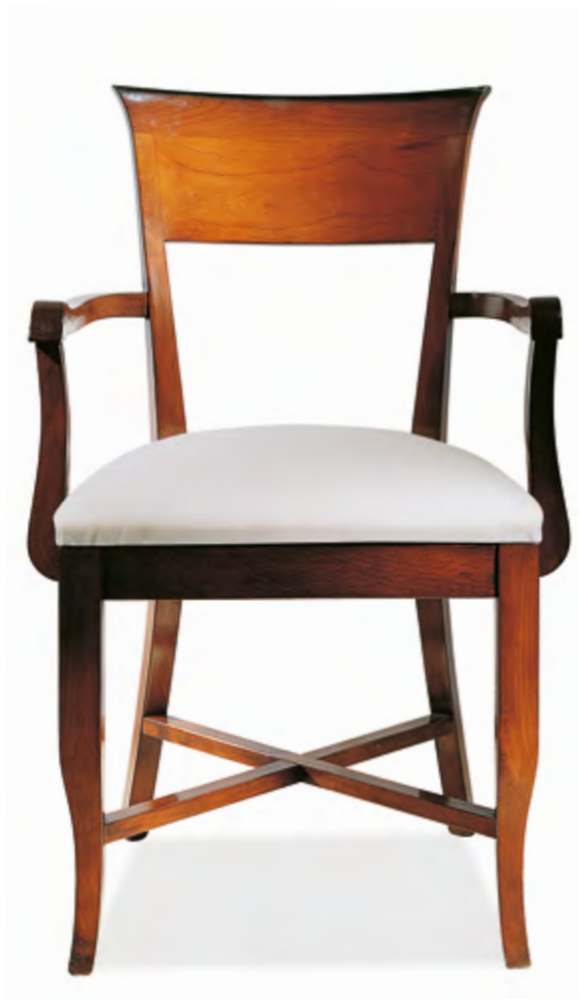
B44 FAUTEUIL BANDEAU LARGE