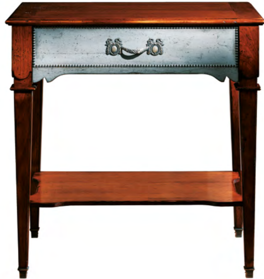
B6042 CHEVET DE STYLE DIRECTOIRE