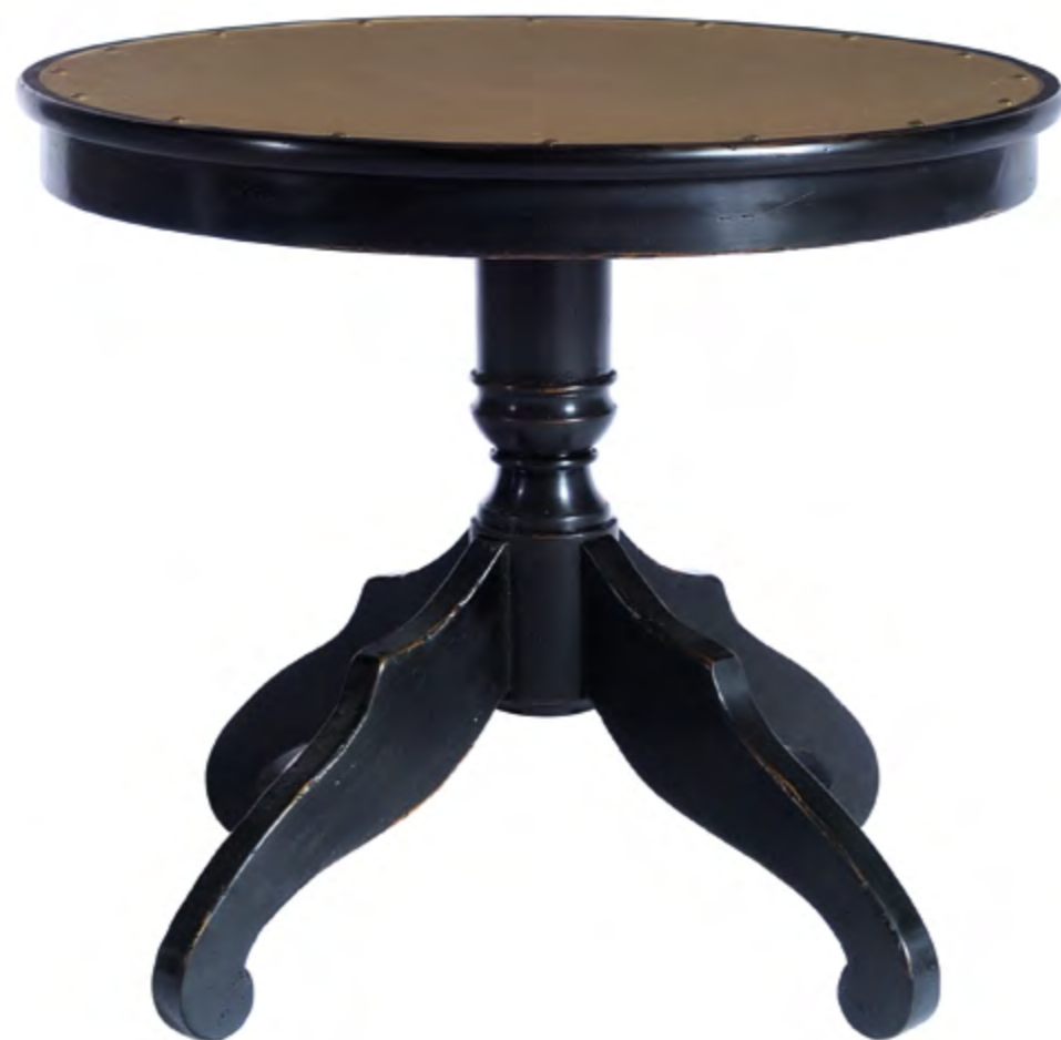
B6103 GUERIDON DE STYLE ANGLAIS