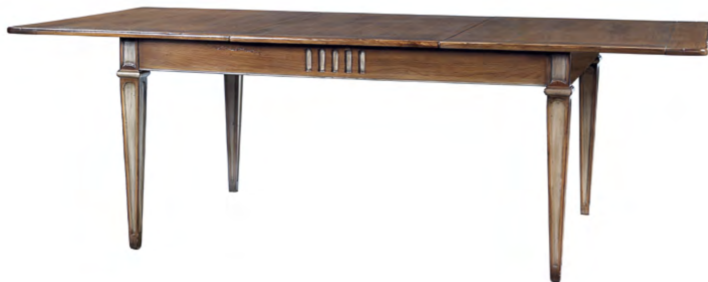
B290 TABLE DE REPAS RECTANGULAIRE