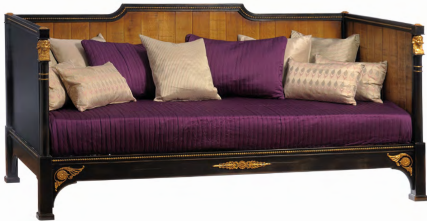
B7103 CANAPE DE STYLE EMPIRE