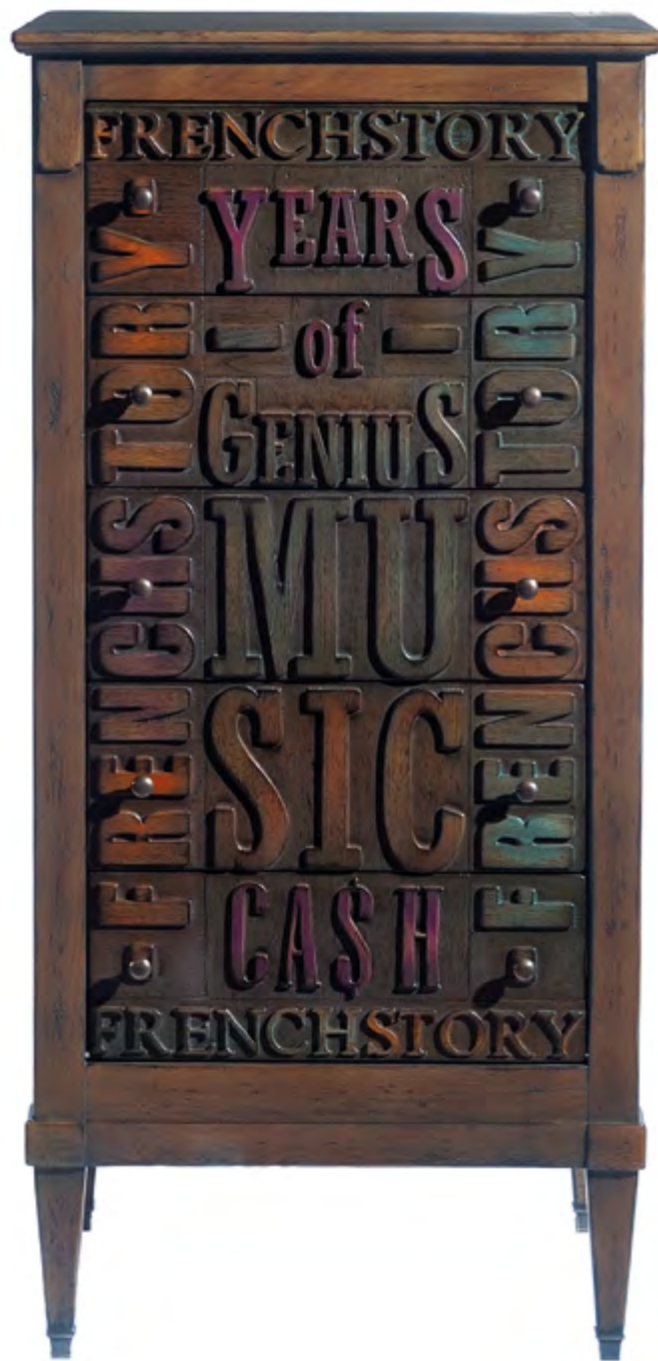
B791 COMMODE 5 TIROIRS