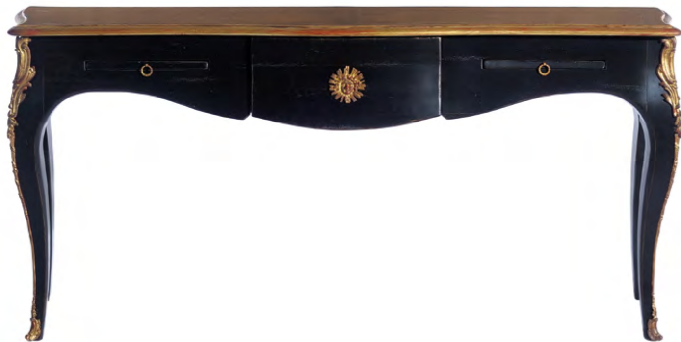
B9101 CONSOLE DE STYLE LOUIS XV