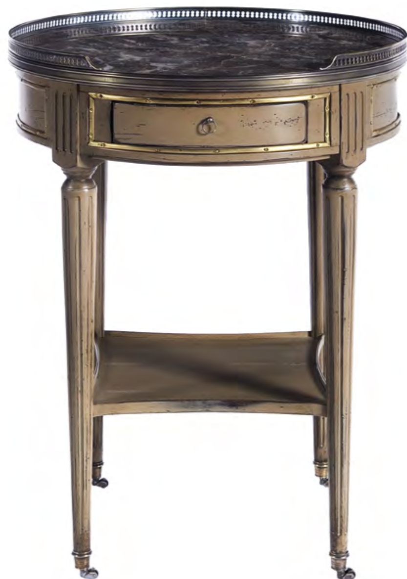
B651 GUERIDON ROND MARBRE