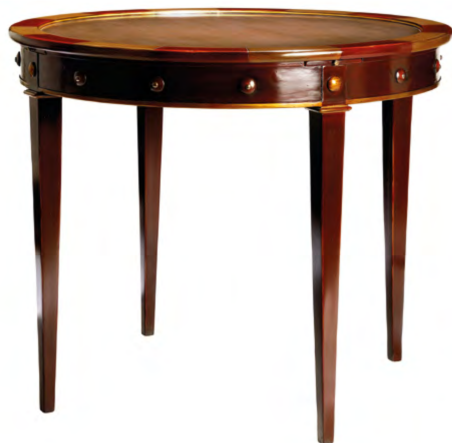
B6104 TABLE A JEUX