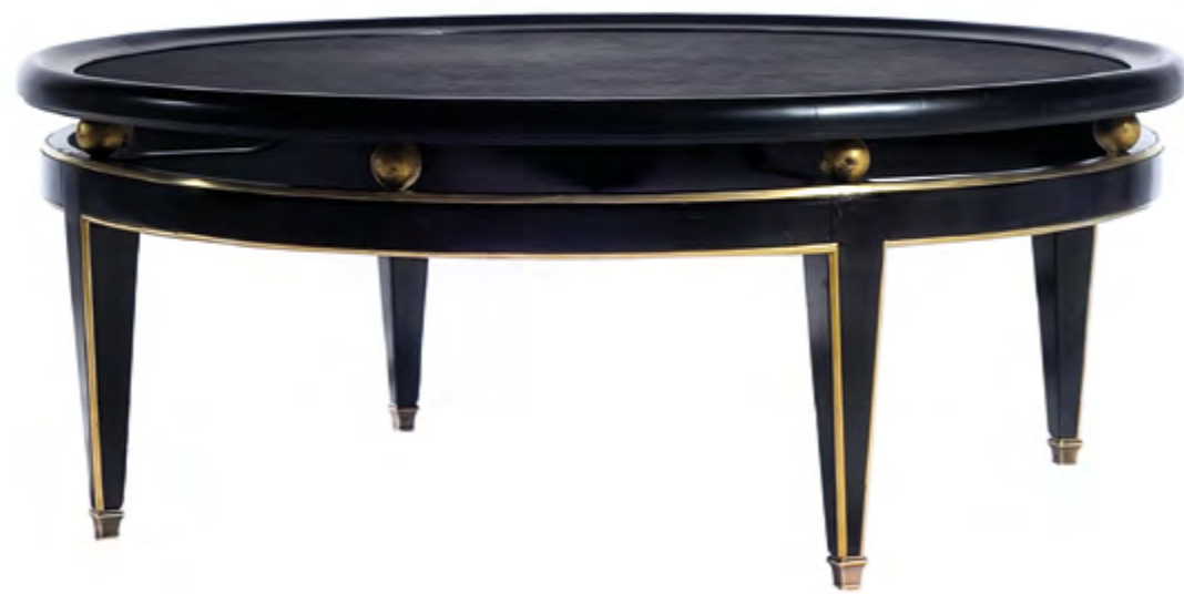
B841 TABLE BASSE RONDE DE STYLE LOUIS XVI