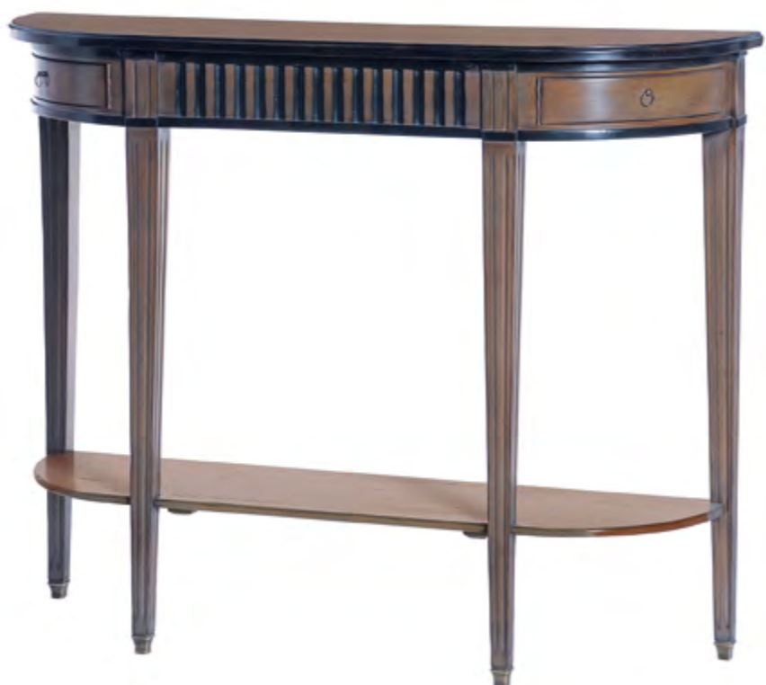
B906 PETITE CONSOLE DE STYLE LOUIS XVI