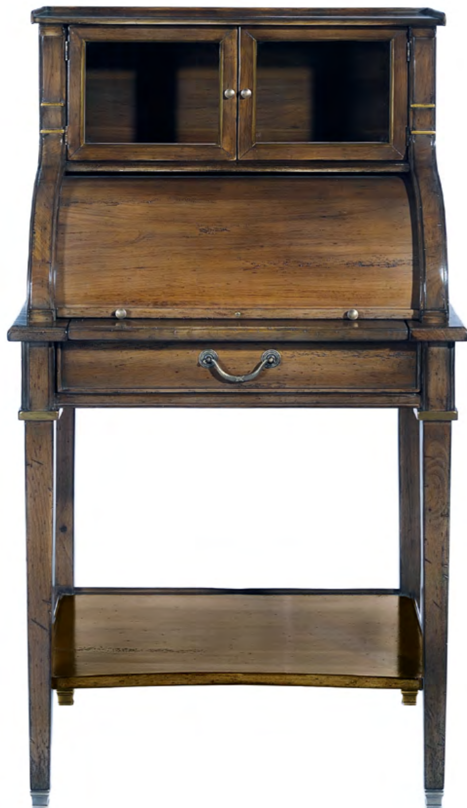
B659 BUREAU CYLINDRE