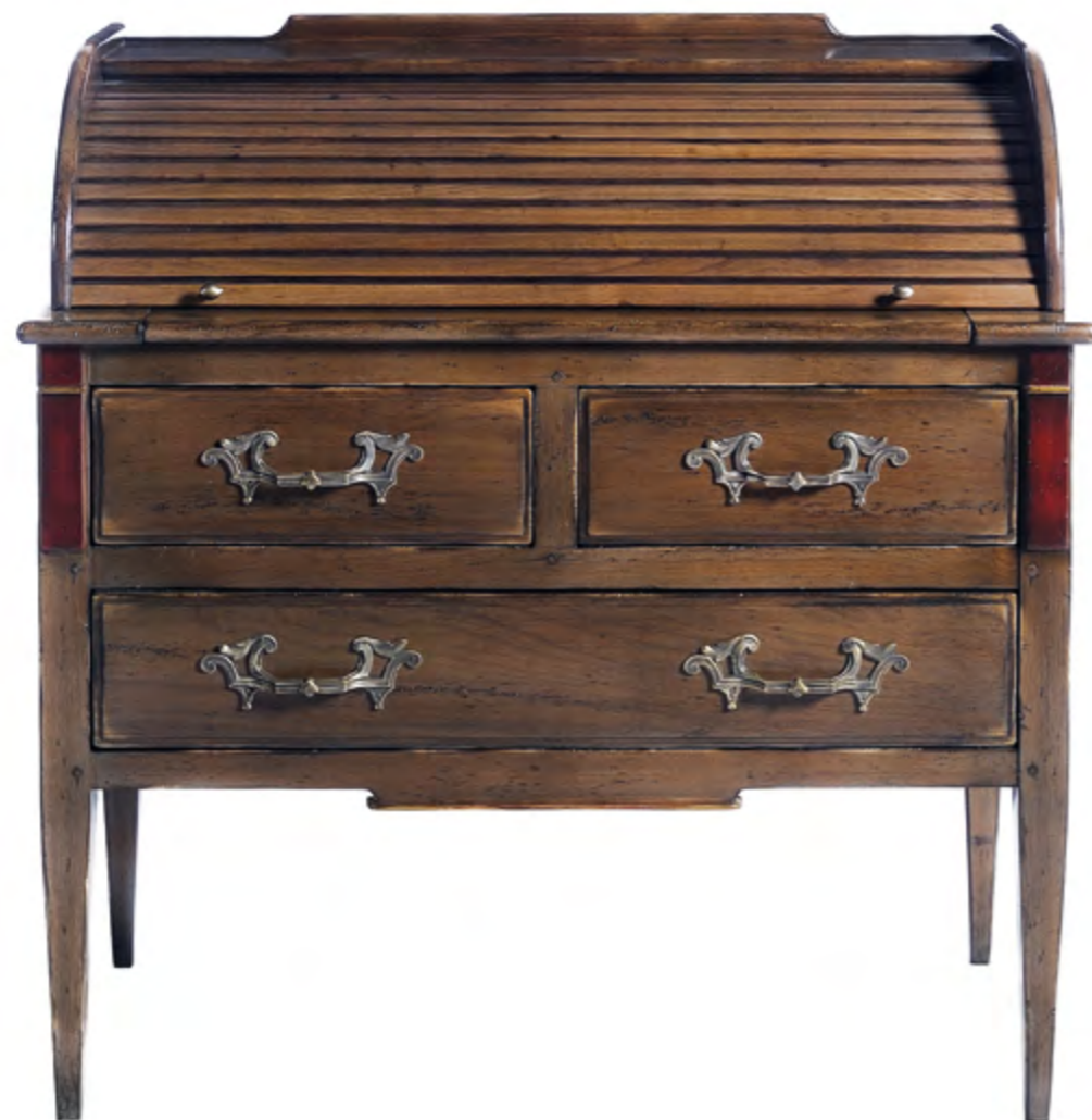
B531 SECRETAIRE A RIDEAU