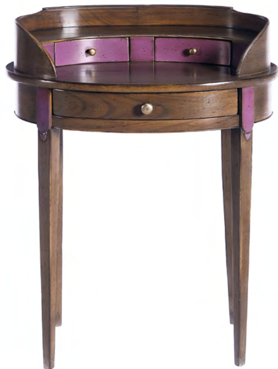
B629 TABLE OVALE DE STYLE DIRECTOIRE