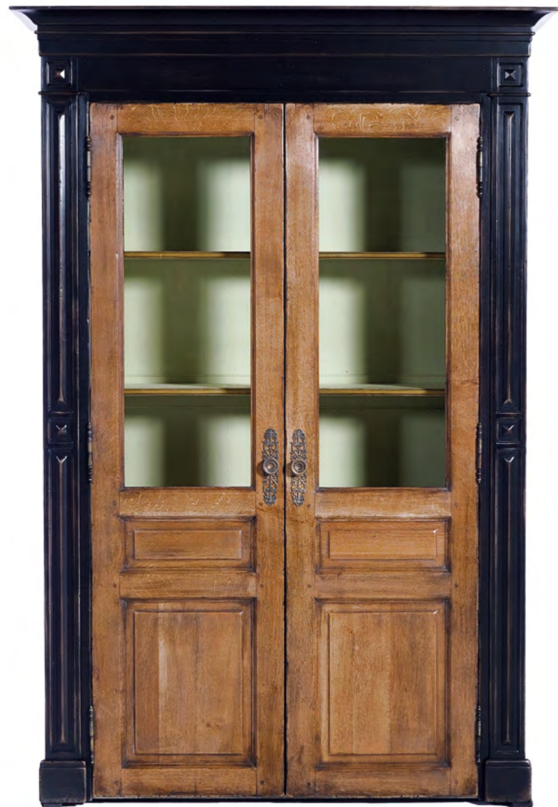
B392 BIBLIOTHEQUE PORTES VITREES