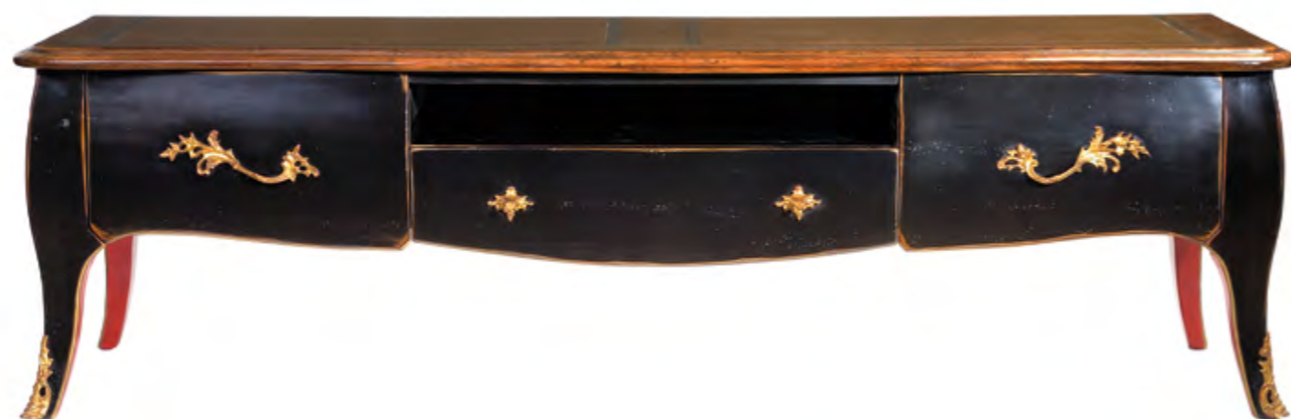
B7102 SUPPORT TV DE STYLE LOUIS XV