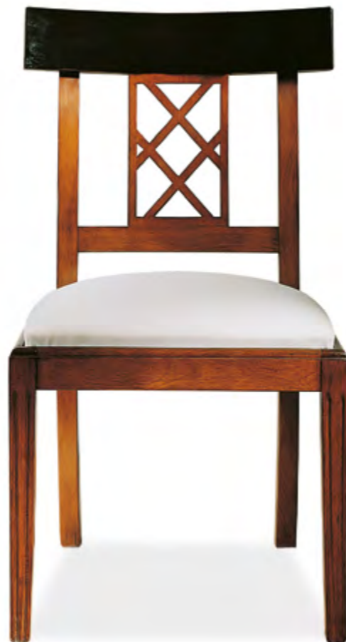
B15 CHAISE A DOSSIER CROISILLON