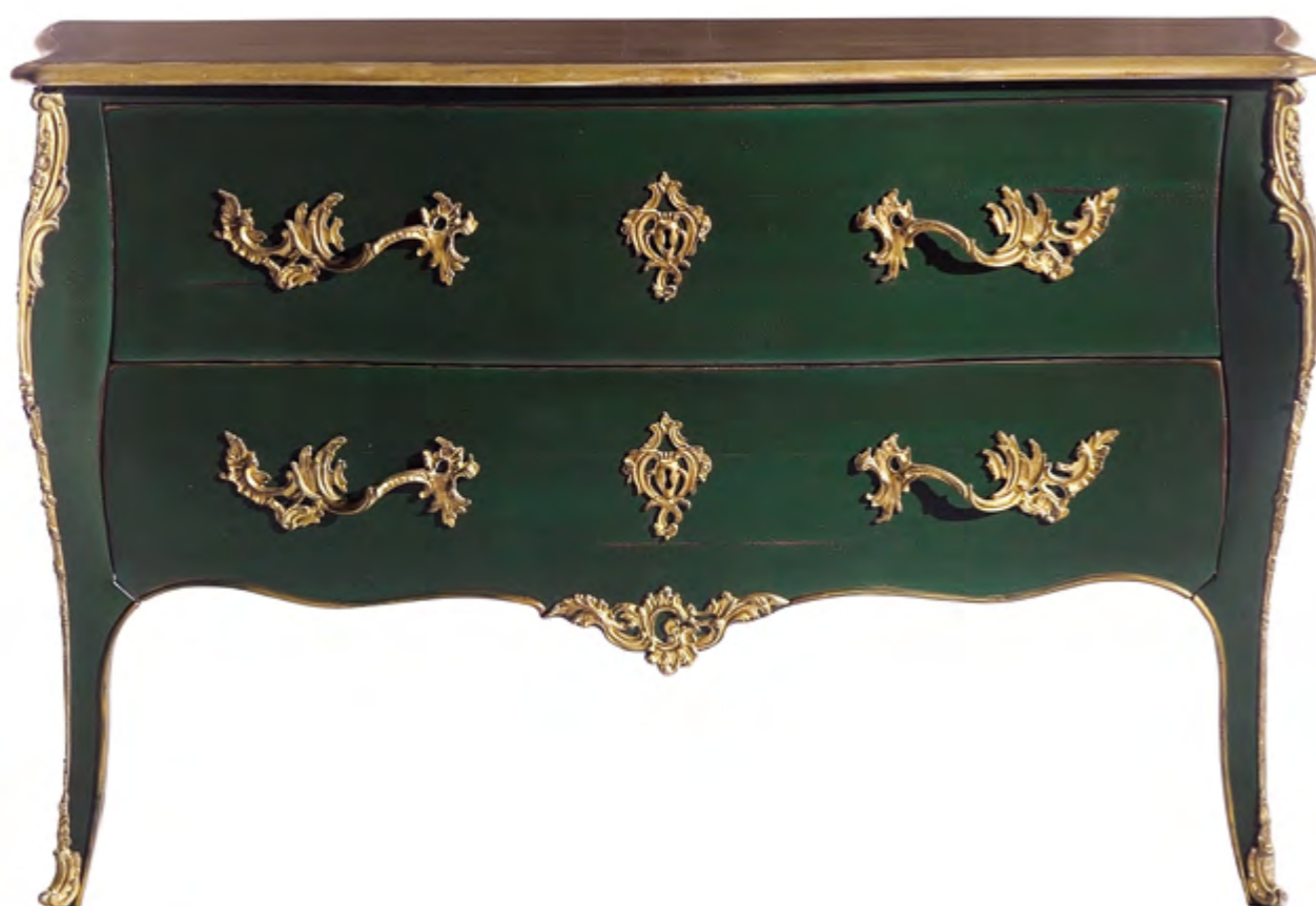
B4100 COMMODE DE STYLE LOUIS XV