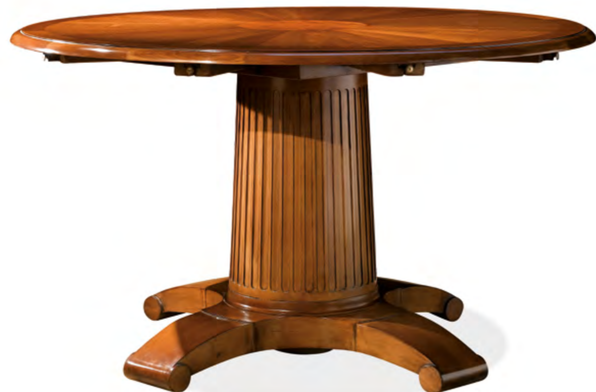
B261 TABLE RONDE 4 ALLONGES