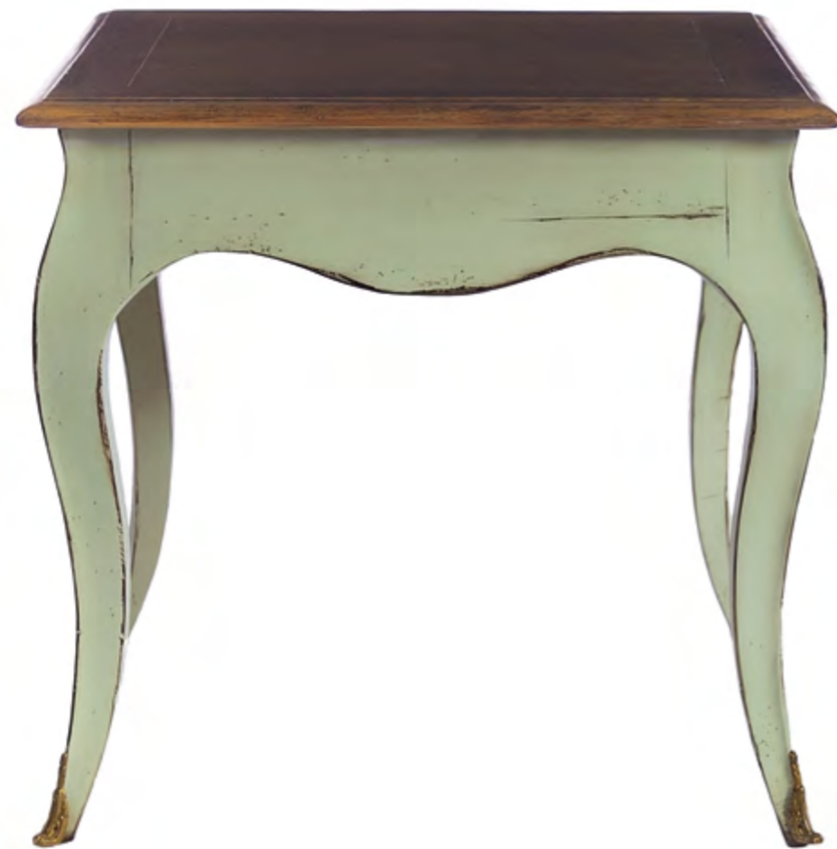
B6021 BOUT DE CANAPE DE STYLE LOUIS XV