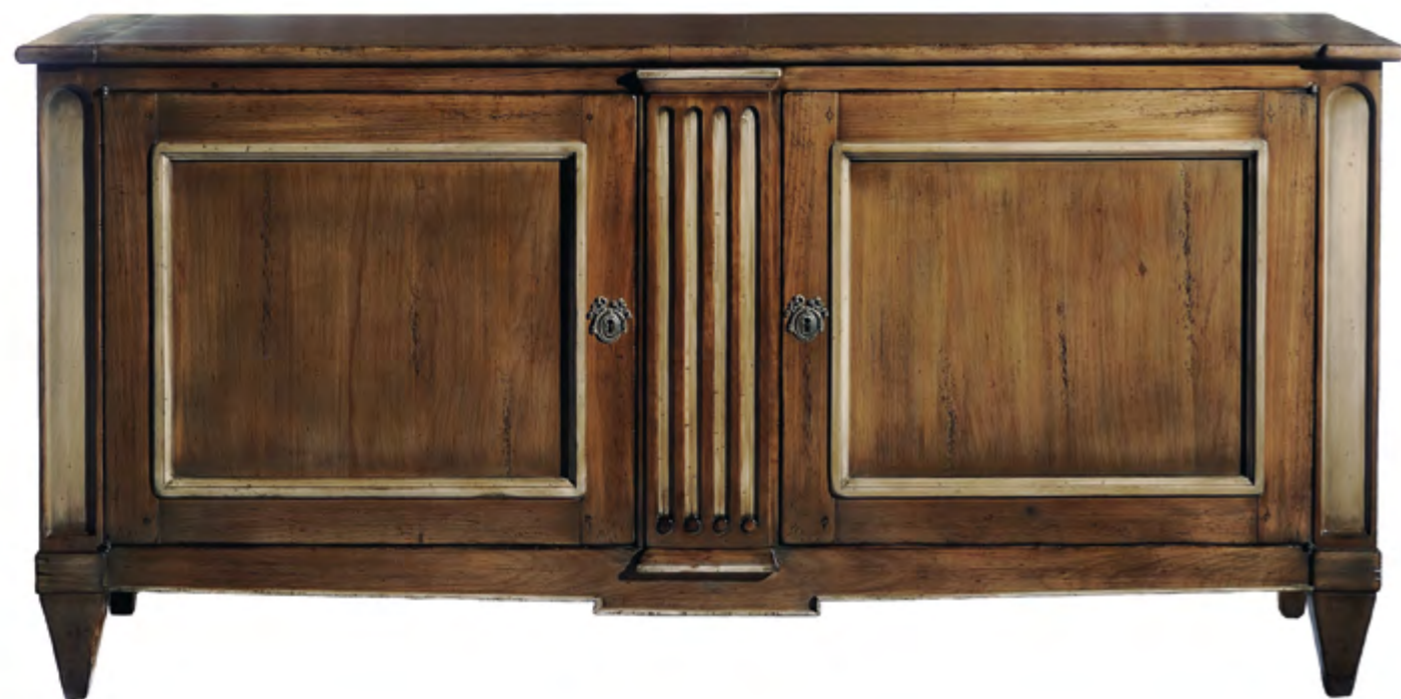
B191 BAHUT DE STYLE LOUIS XVI