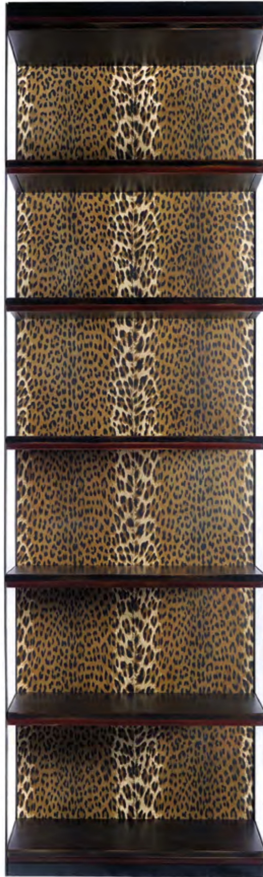
B752 ETAGERES METALLIQUES