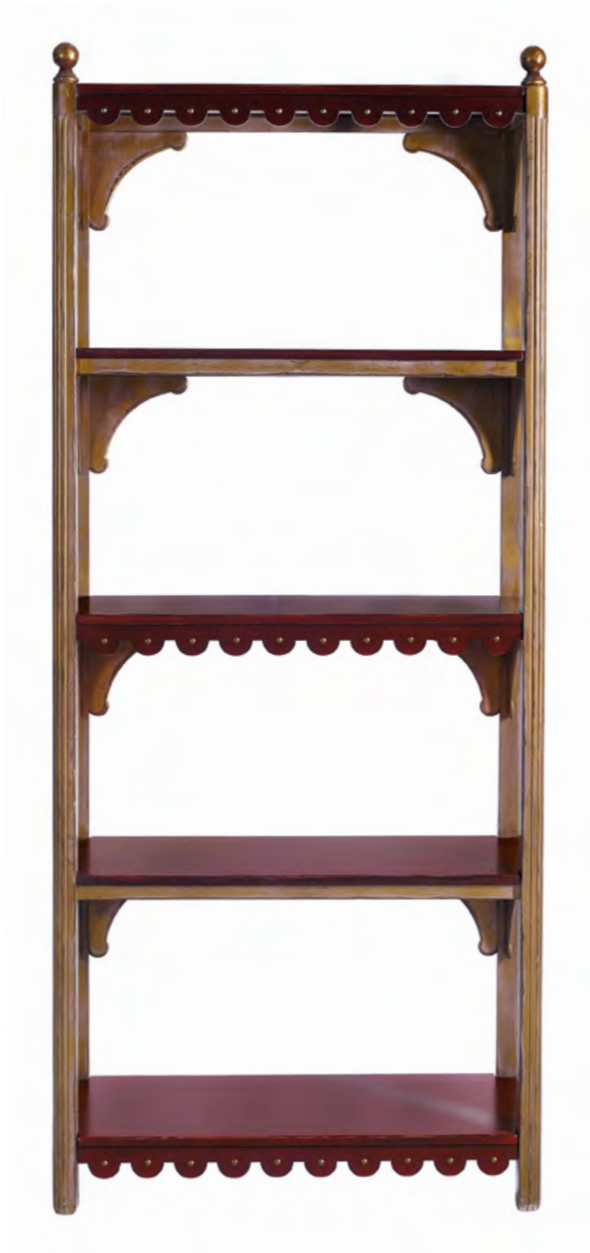
B391 BIBLIOTHEQUE DE STYLE LOUIS XV