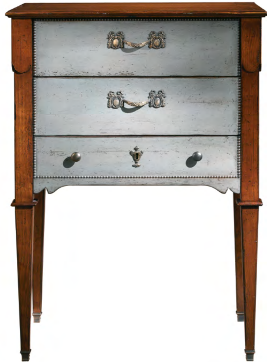
B6043 PETITE COMMODE DE STYLE DIRECTOIRE