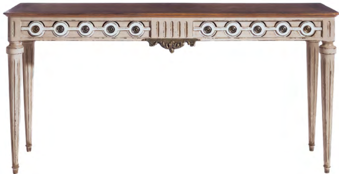
B913 CONSOLE DE STYLE LOUIS XVI