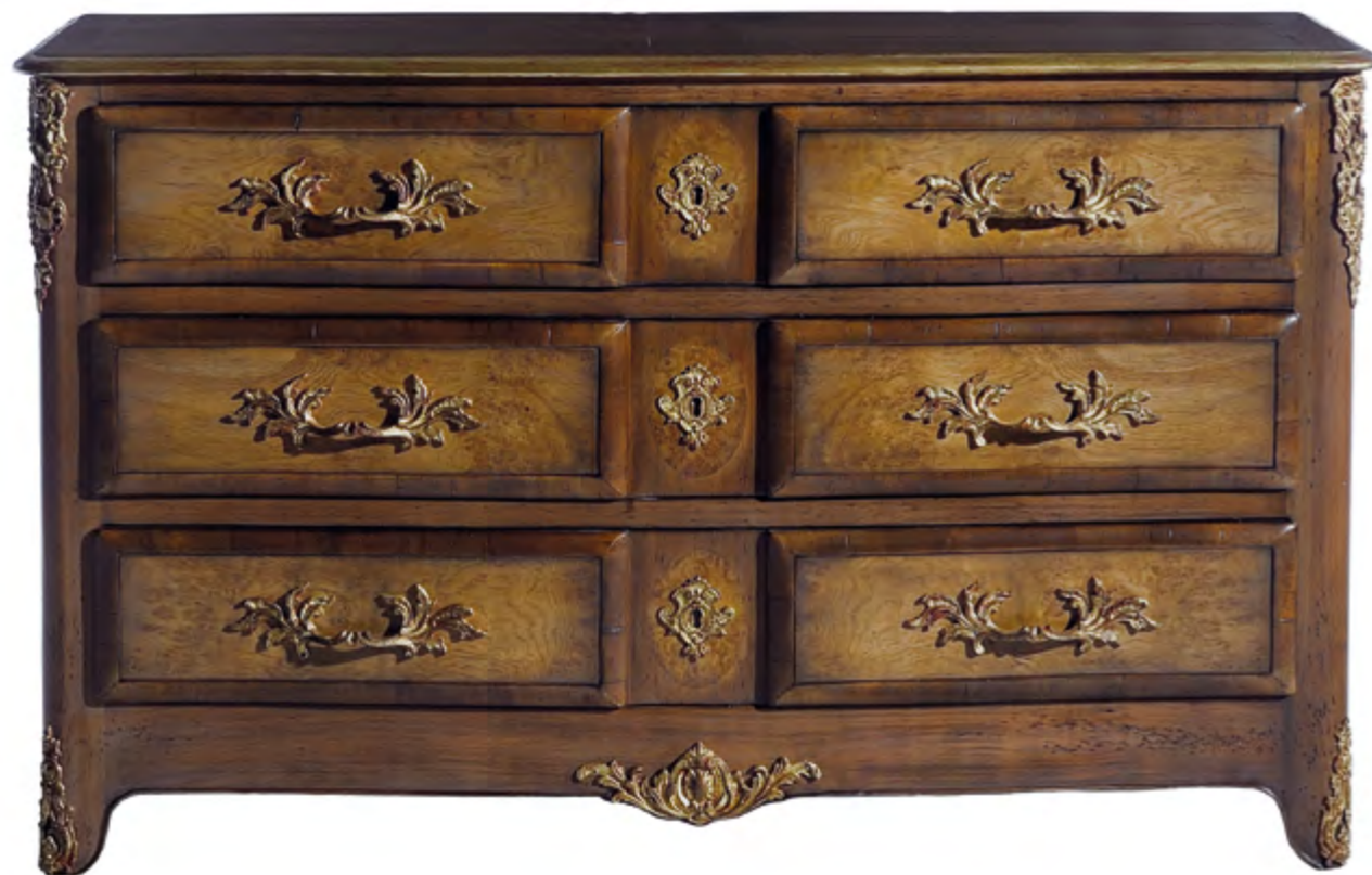
B4101 COMMODE DE STYLE LOUIS XIV