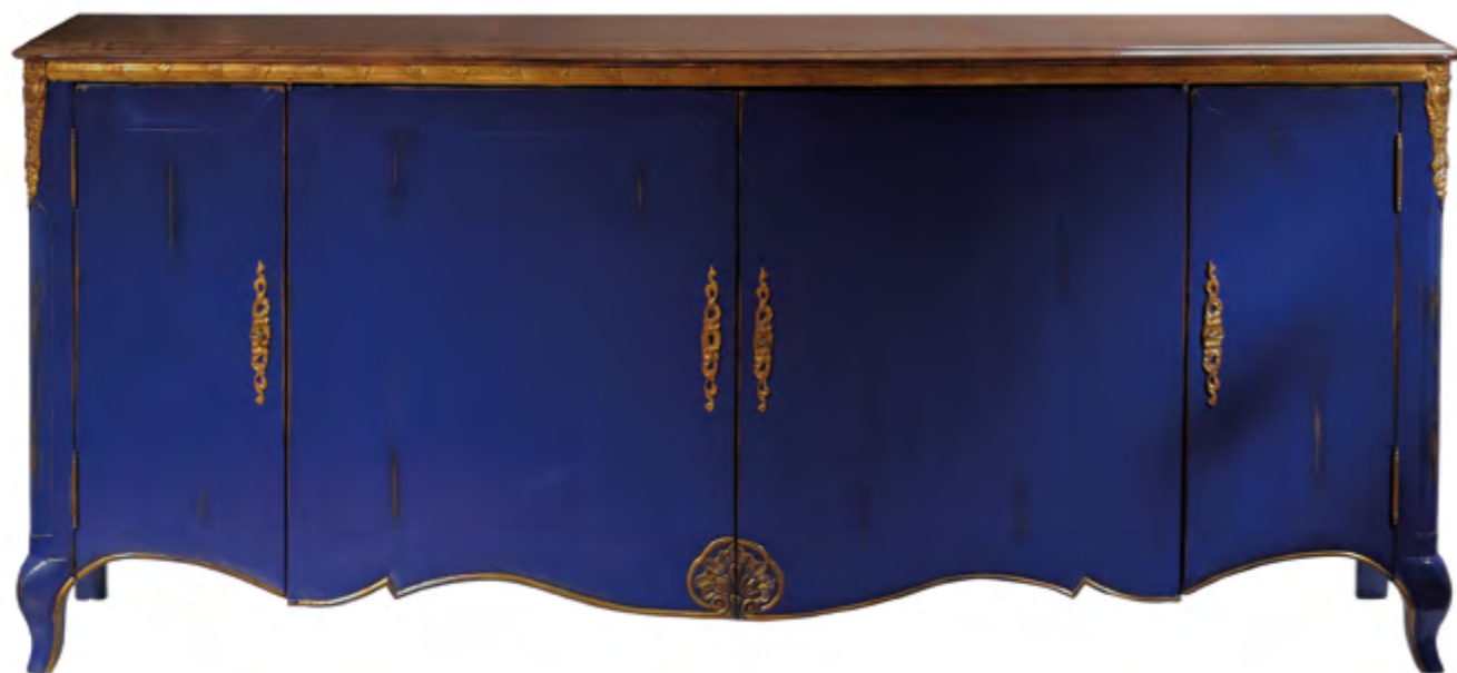
B128 BAHUT DE STYLE LOUIS XV