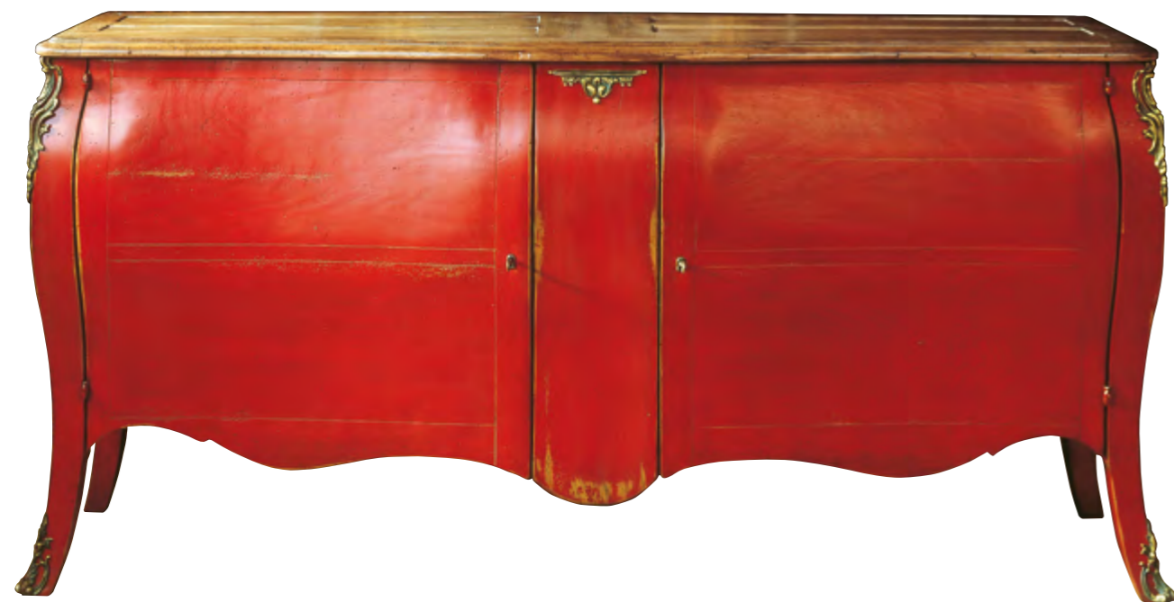
B110 COMMODE A PORTES DE STYLE LOUIS XV

Deckplatte aus Wildkirsche Rahmen, Umrahmung, Traversen und Seitenplatten aus Linde Ausgebauchte Türen furniert auf Massivgestell Boden, Rückseite, Einlegeböden aus einheimischem Holz (Erle, Eiche, Kastanie, Kiefer) 1 nicht zerlegbares Element Maße: B 184 x H 90 x T 55