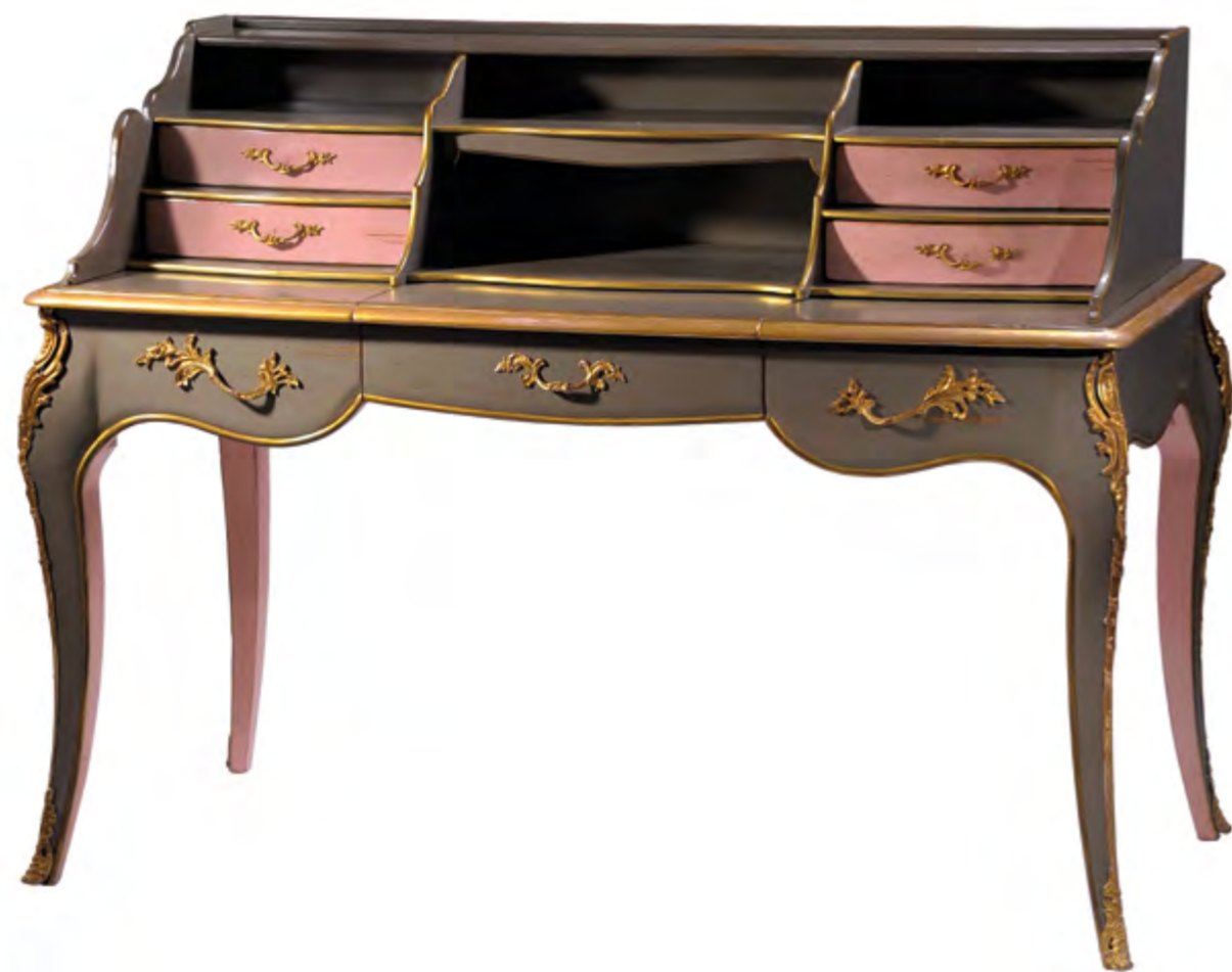
B5101 BUREAU A GRADINS