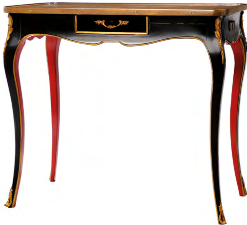
B6106 TABLE A ECRIRE DE STYLE LOUIS XV