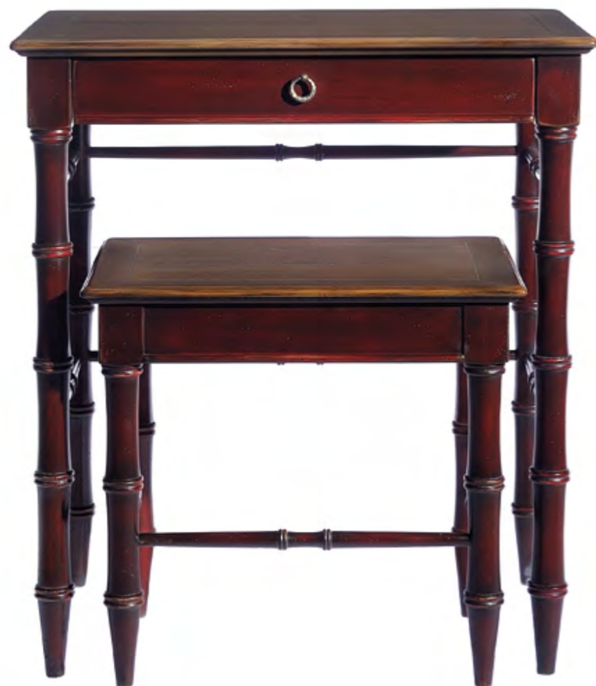
B6022 TABLE GIGOGNES DE STYLE COLONIAL