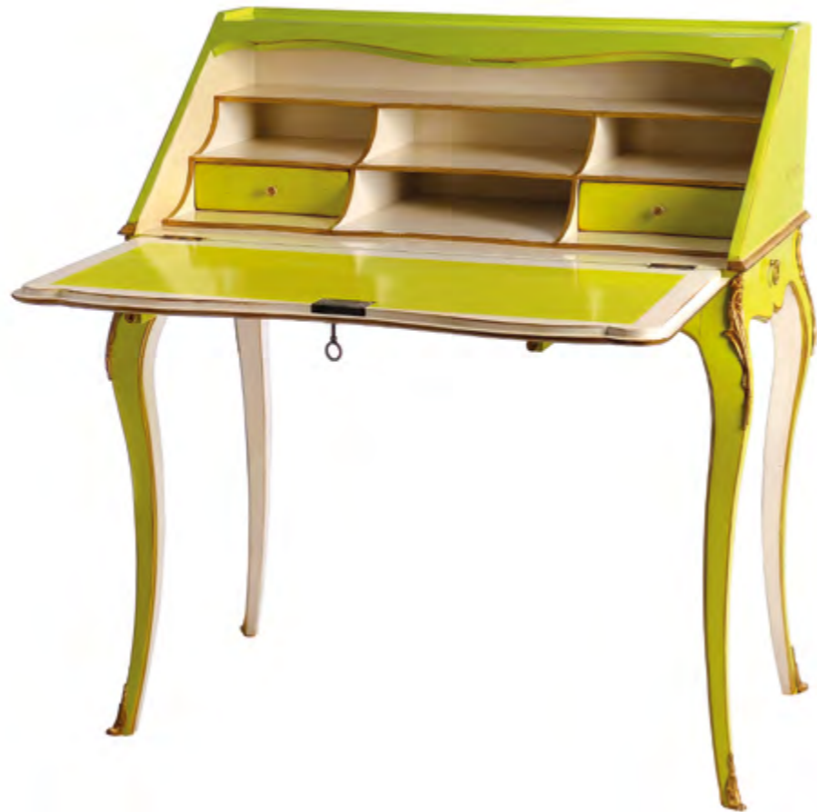
B537 BUREAU DOS D'ANE