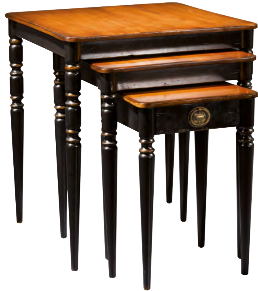
B6013 TABLES GIGOGNES