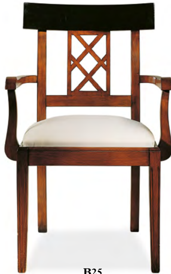
B25 FAUTEUIL A DOSSIER CROISILLON