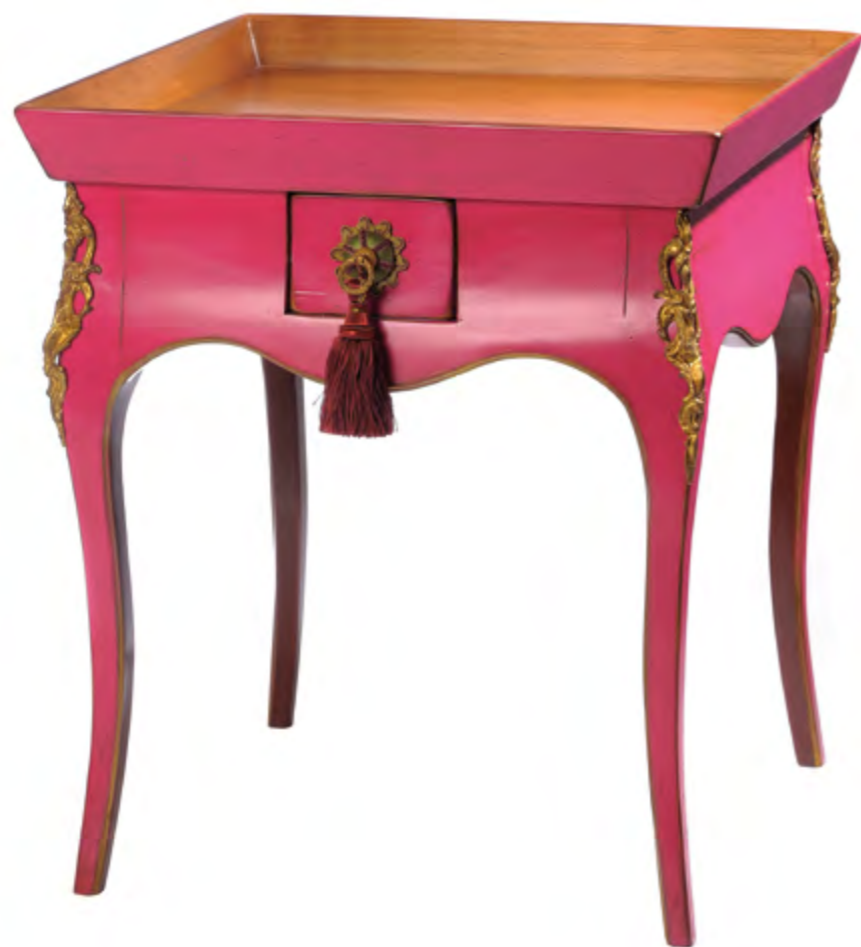
B6105 TABLE A TRICOTER DE STYLE LOUIS XV