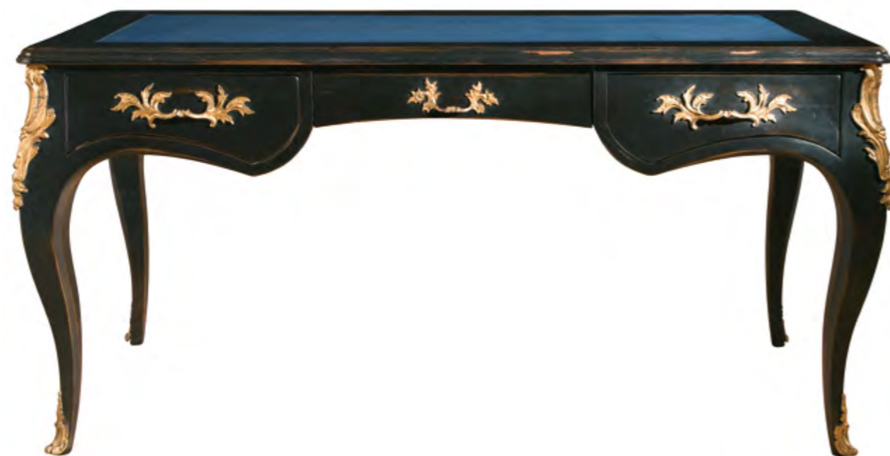
B5100 BUREAU DE STYLE LOUIS XV

3 Schubladen in der Zarge Rahmen, Umrahmung, Traversen, Schubladenfront aus Eiche Schubladenkorpus, Gleitführungen aus Eiche Ein nicht zerlegbares Element Maße: B 161 x H 78 x T 81