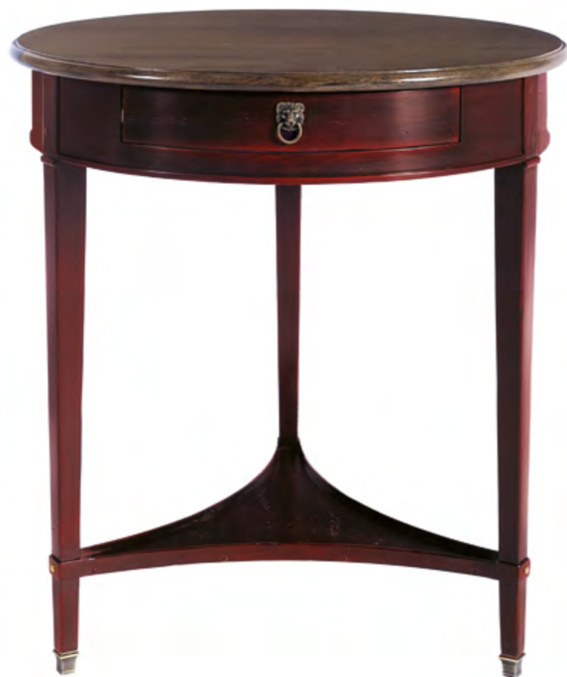
B634 TABLE CONSOLE RONDE 3 PIEDS