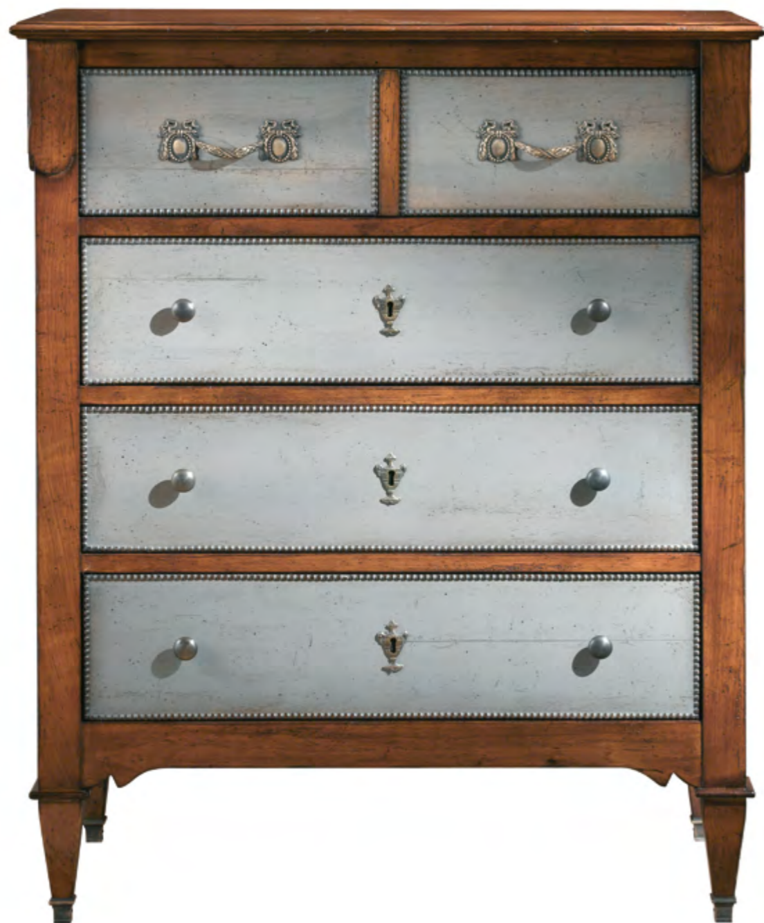
B6044 COMMODE DE STYLE DIRECTOIRE