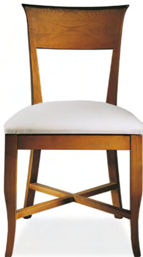
B4 CHAISE DOSSIER BANDEAU LARGE