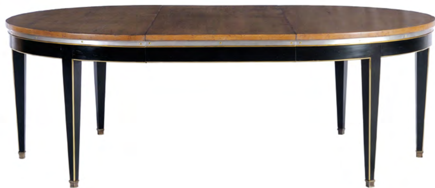
B291 TABLE RONDE DE STYLE LOUIS XVI