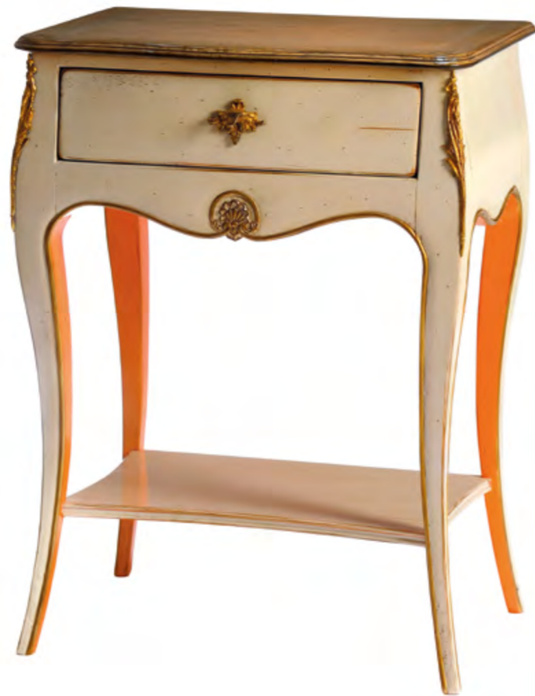
B6023 CHEVET DE STYLE LOUIS XV